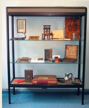
Stadtgeschichtliches Museum Linxweilerstraße 5 66564 Ottweiler